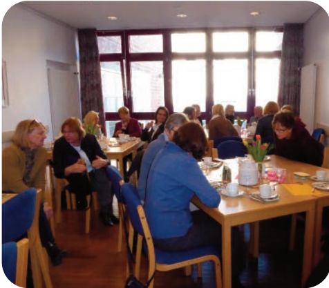
Das traditionelle Neujahrsfrühstück im Gemeindehaus der Münsterkirche

Bilder sagen mehr als tausend Worte. An den vielen fröhlichen Momenten, die wir im Bild festgehalten haben, lassen wir Sie gerne teilhaben.