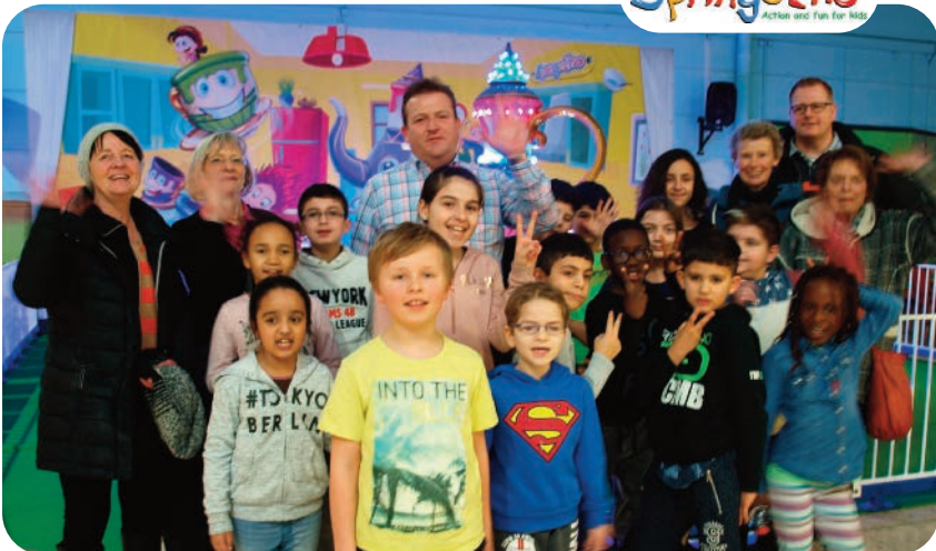
Das vielfältige Angebot im Springolino Iud zum Spielen und Spaß haben ein