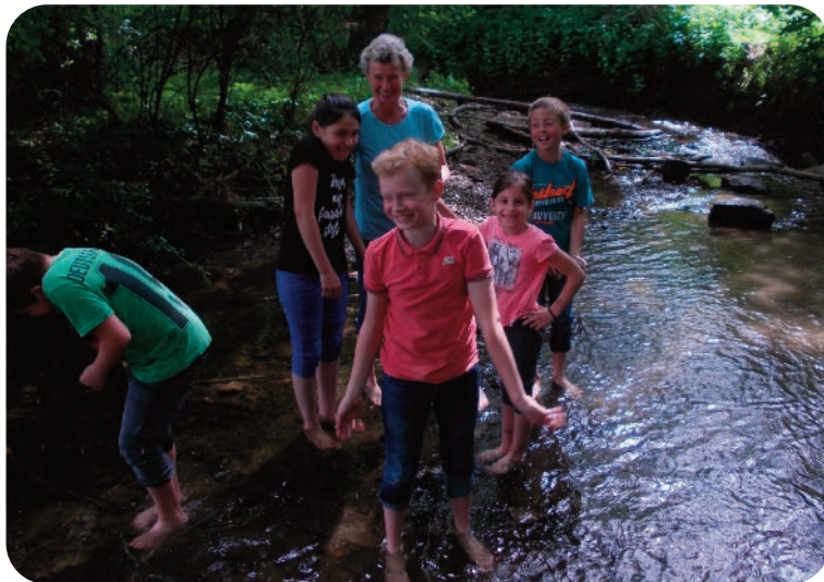
Im Wald ging es auf Entdeckungstour: Für viele Kinder ein echtes Neuland